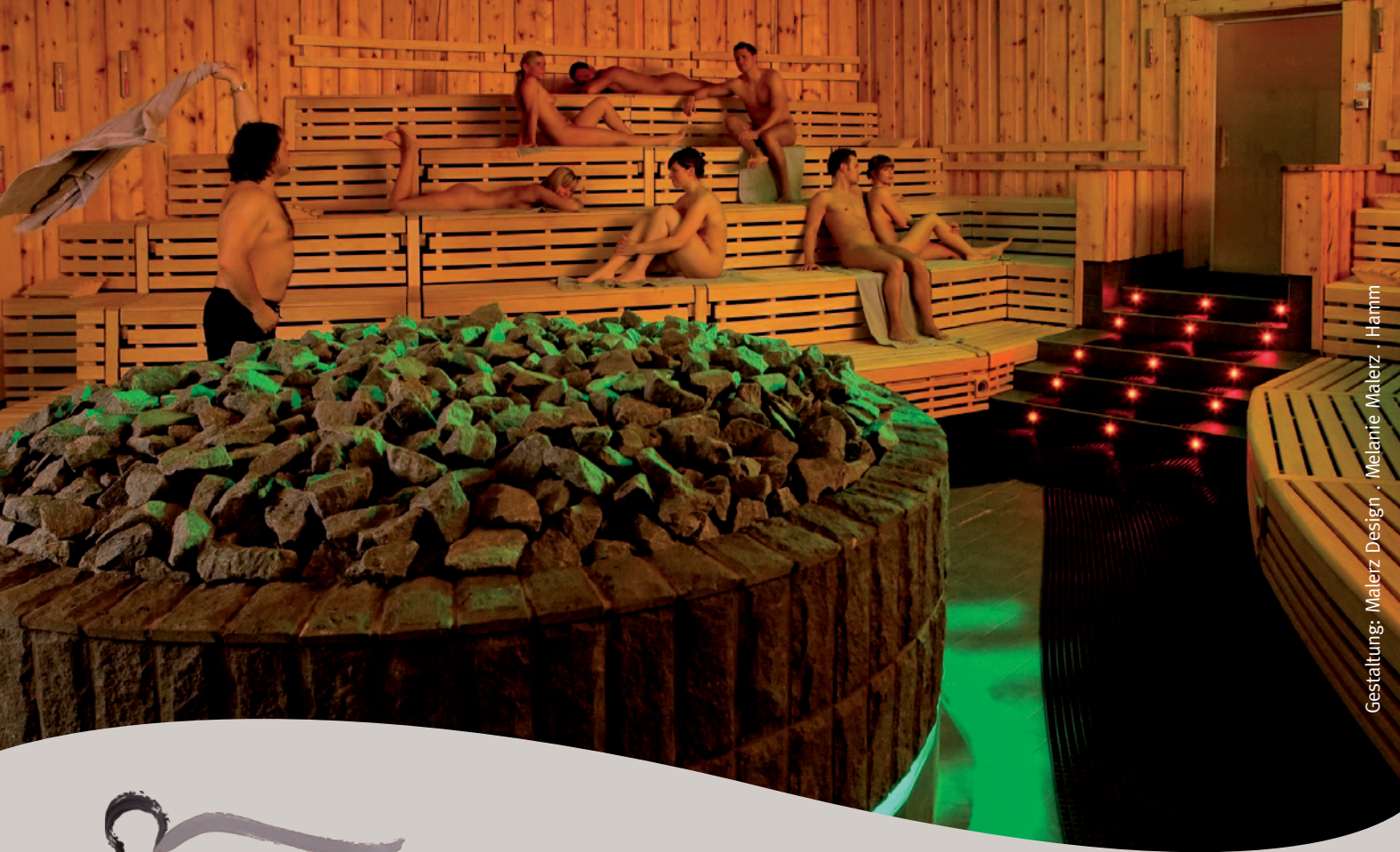
Gestaltung: Melerz Design · Melanie Melerz · Hamm