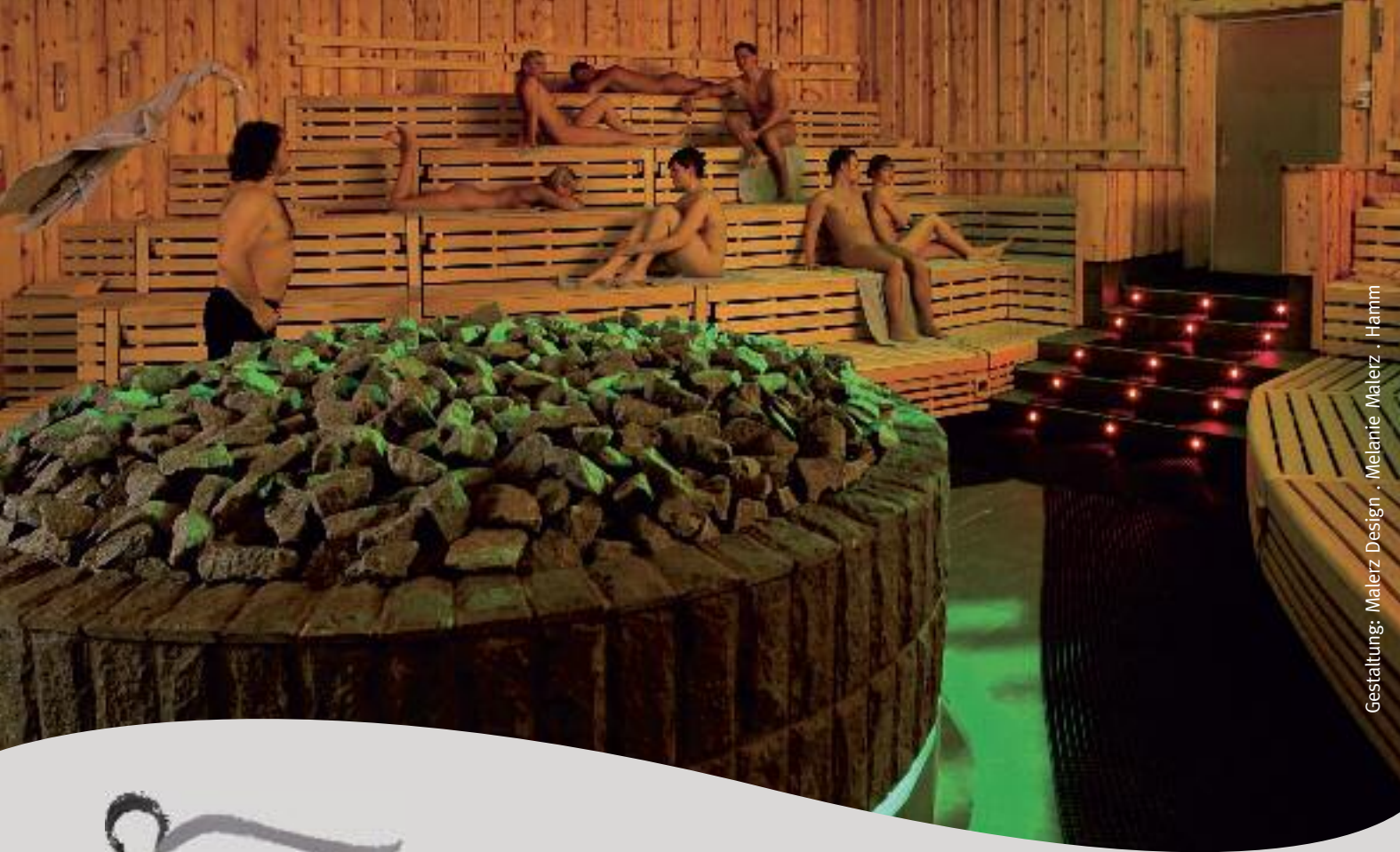
Gestaltung: Melerz Design · Melanie Melerz · Hamm